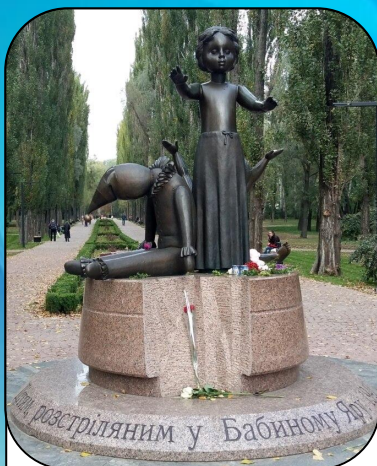
Пам'ятник дітям, розстріляним у Бабиному Яру